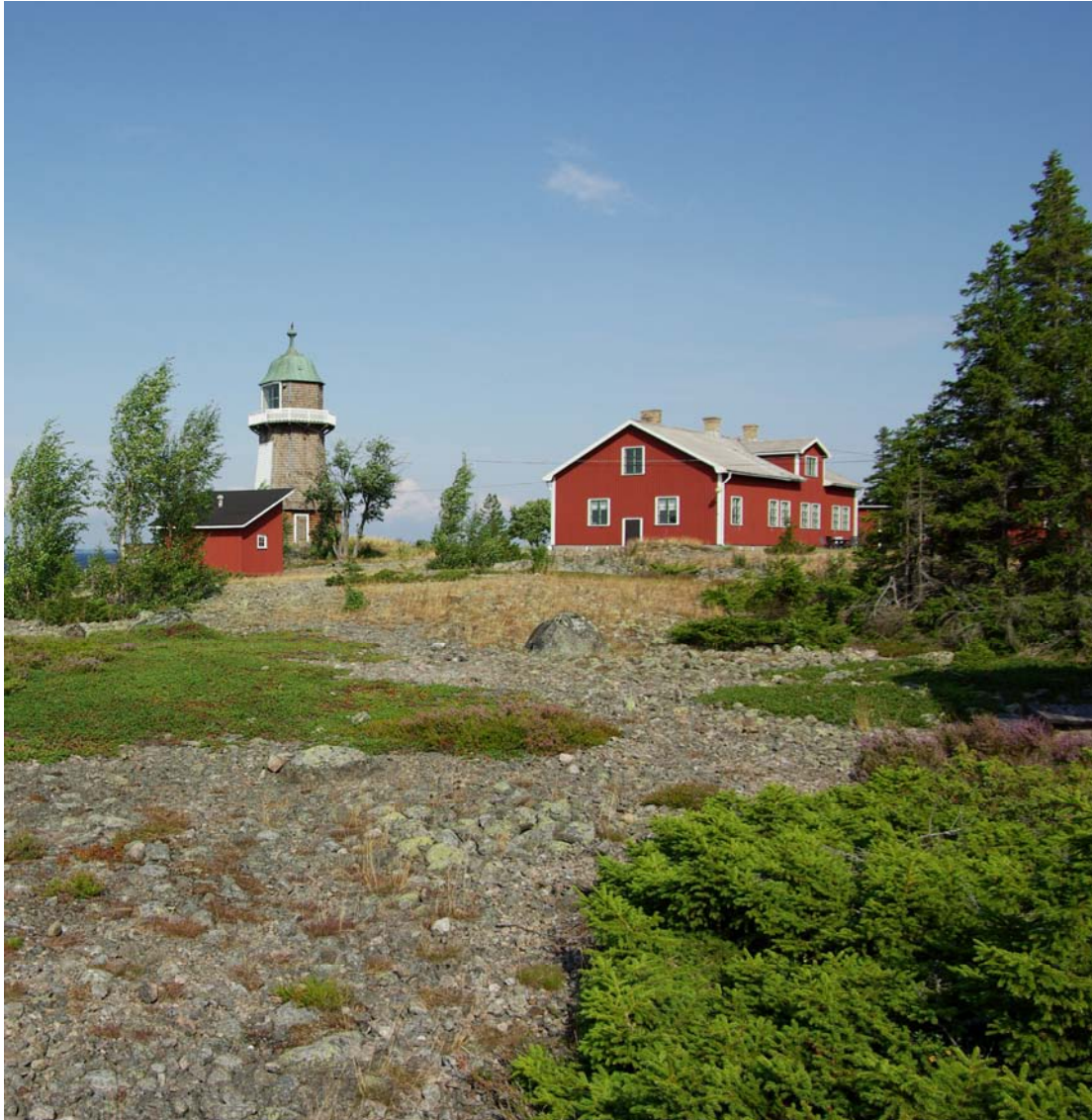
Bergguddens fyrplats på Holmöns västra sida.

Delar av området är också av riksintresse för naturvården och av riksintresse som Natura2000-område (enligt 4 kap. miljöbalken). Inom området finns även två områden av riksintresse för kulturmiljövården – Holmöns by och Stor-Fjäderägg.